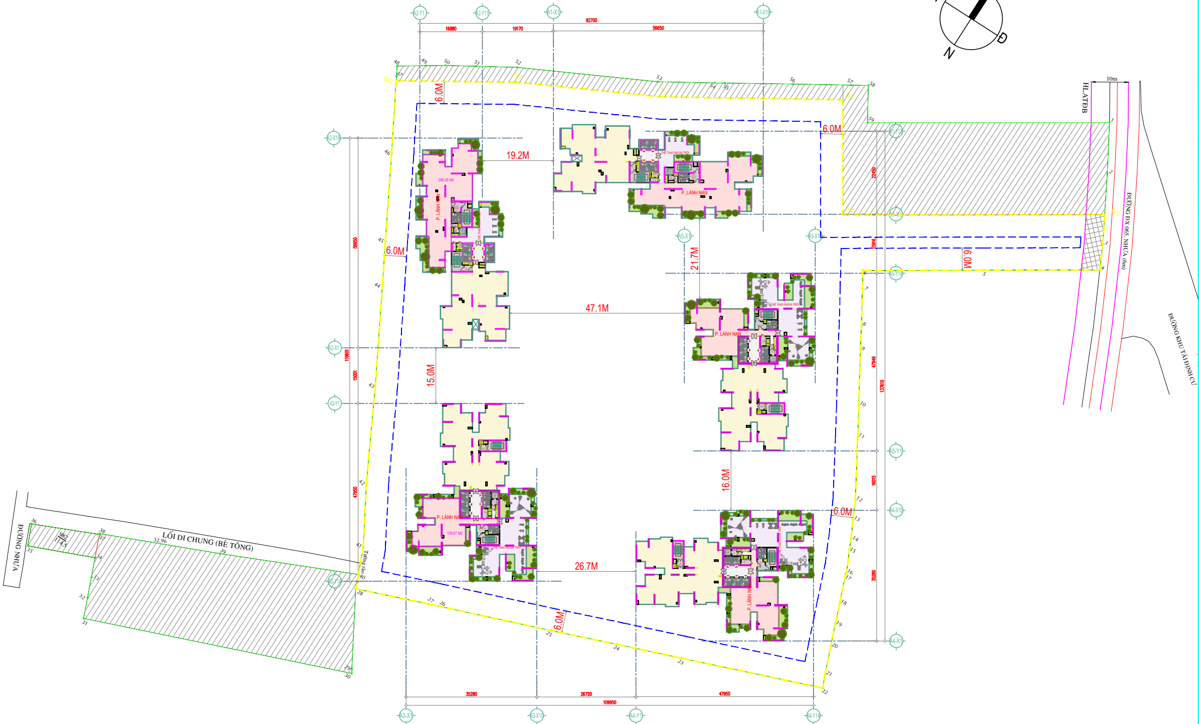
MẶT BẰNG TỔNG THỂ TẦNG 14 - MẶT BẰNG TẦNG LÁNH NẠN